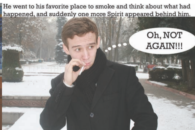
He went to his favorite place to smoke and think about what had happened, and suddenly one more Spirit appeared behind him.