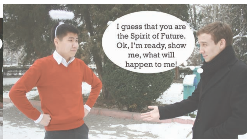
I guess that you are the Spirit of Future. Ok, I'm ready, show me, what will happen to me!