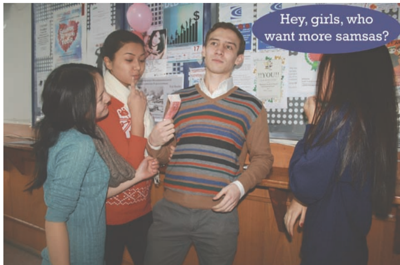
Hey, girls, who want more samsas?