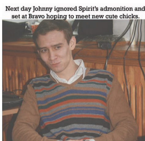
Next day Johnny ignored Spirit's admonition and set at Bravo hoping to meet new cute chicks.