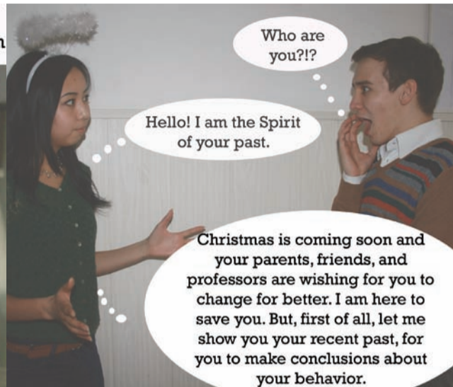
Who are you?!?