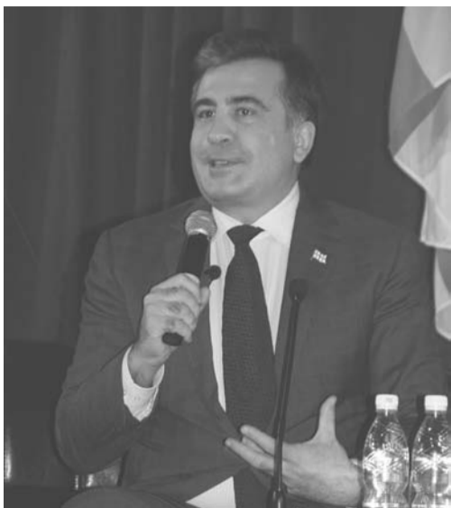
1 декабря 2011 года президент Грузии Михаил Саакашвили посетил Американский университет в Центральной Азии. Сюда