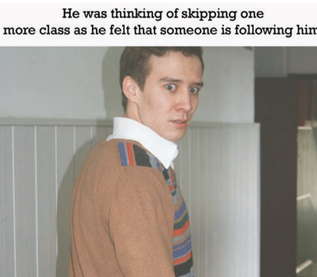
He was thinking of skipping one more class as he felt that someone is following him