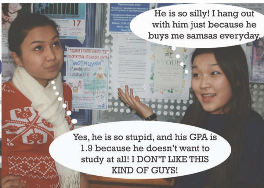
He is so silly! I hang out with him just because he buys me samsas everyday.