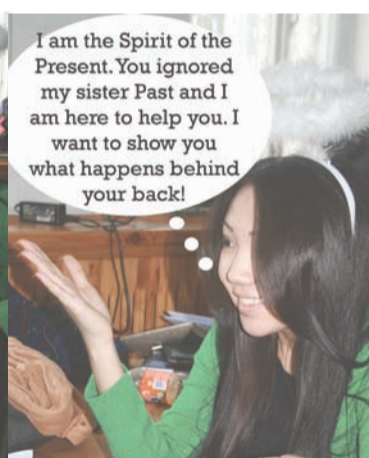
I am the Spirit of the Present. You ignored my sister Past and I am here to help you. I want to show you what happens behind your back!