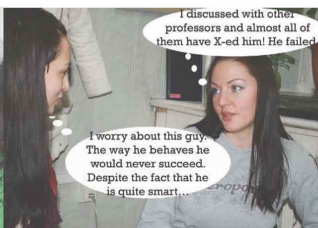
I discussed with other professors and almost all of them have X-ed him! He failed