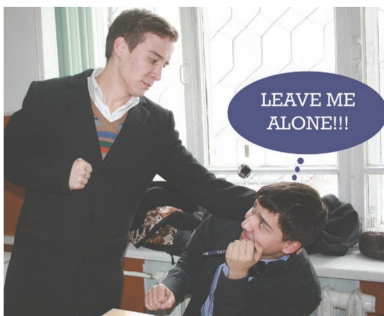
LEAVE ME ALONE!!!