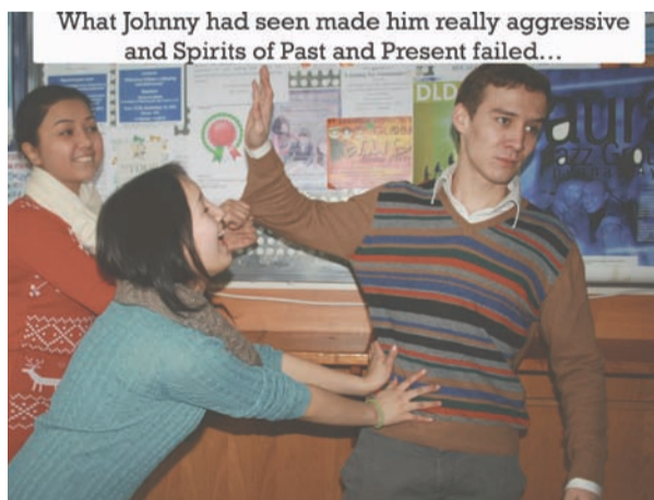
What Johnny had seen made him really aggressive and Spirits of Past and Present failed...