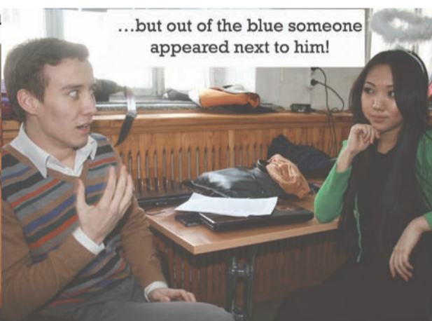
...but out of the blue someone appeared next to him!