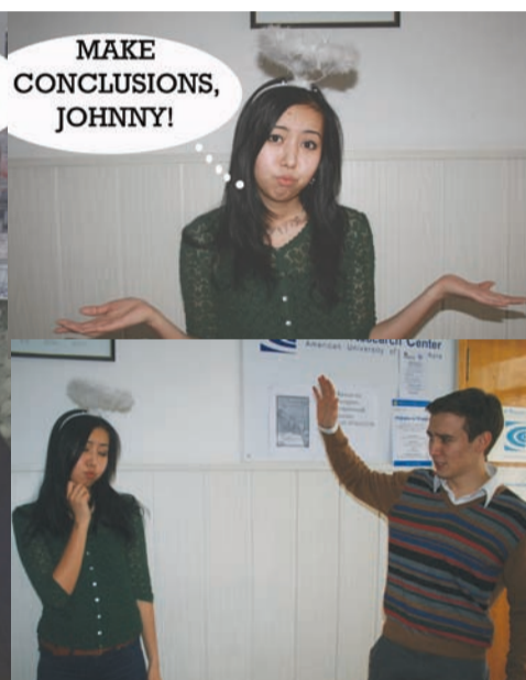
MAKE CONCLUSIONS, JOHNNY!