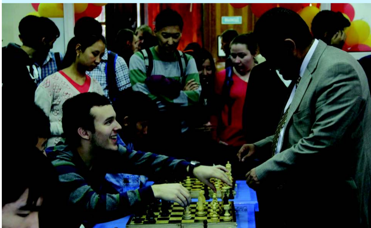
Who is the smartest at AUCA? p.4