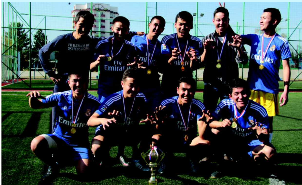
Осенний Кубок АУЦА р.4