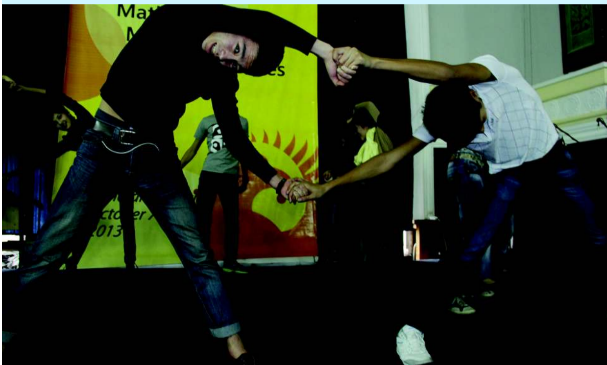
Acting & Energy Workshop p.5