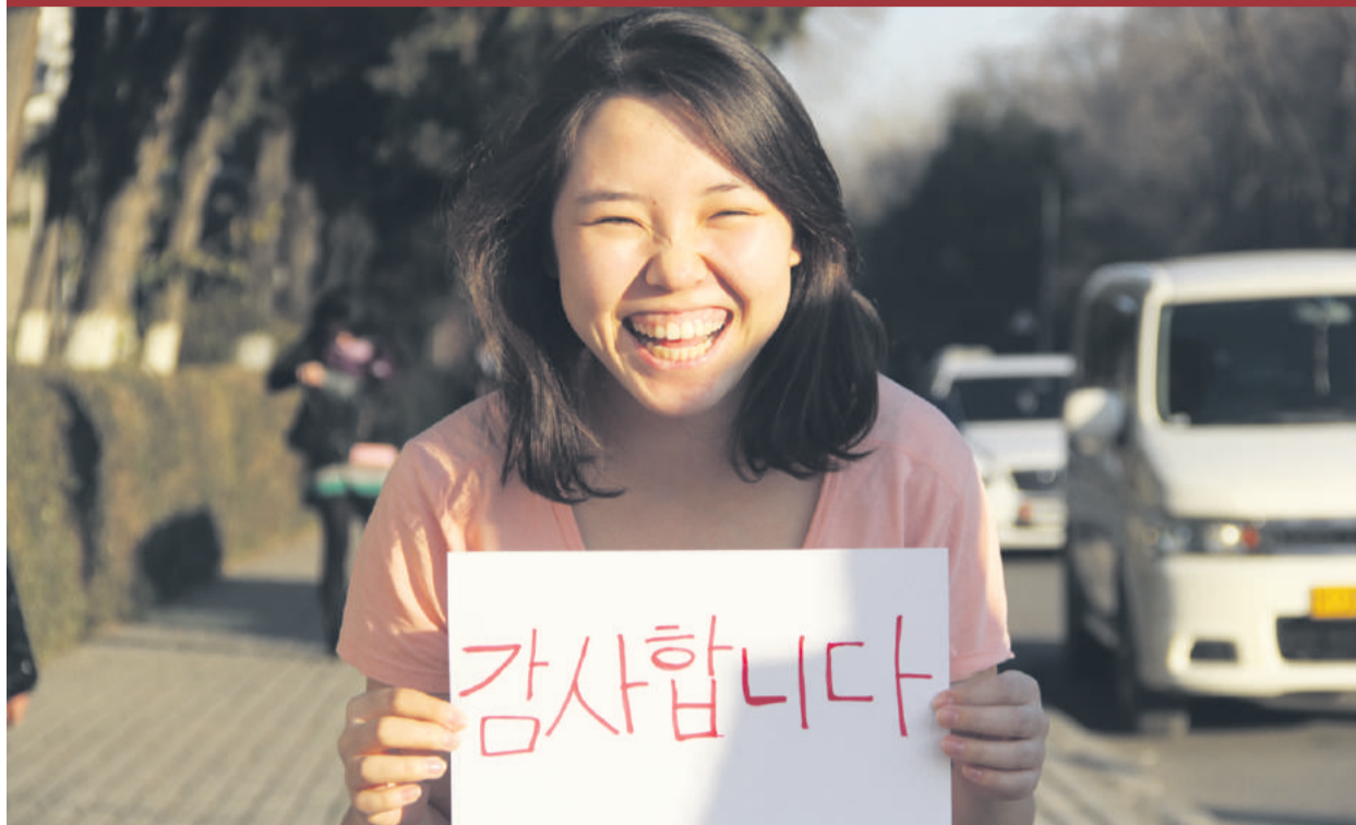
Thank you! p. 4