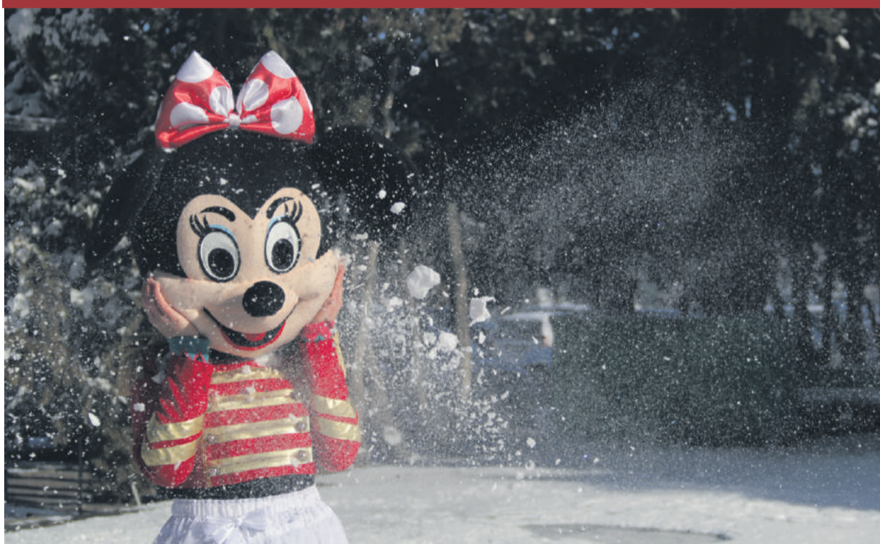
Merry Christmas and Happy New Year! p. 5