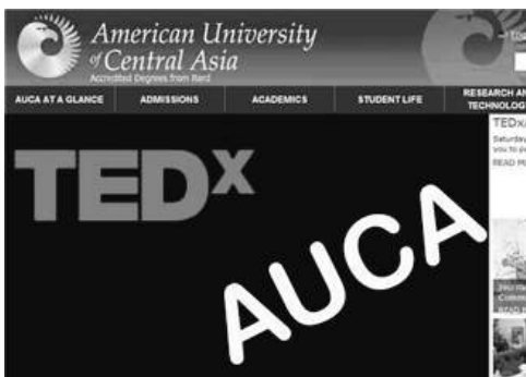
The old AUCA website design (screenshot)

First time I saw the new design of auca.kg I thought I didn't have enough money on my phone to download the page normally (white background and weird font). However, after 7 attempts of reloading I realized AUCA website design was changed.