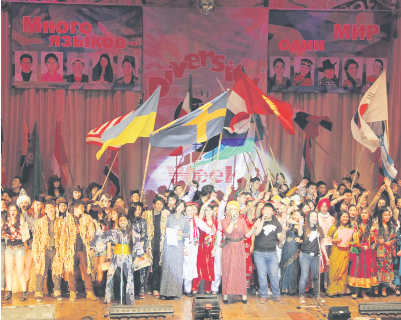
Diversity Week 2014. Final Concert