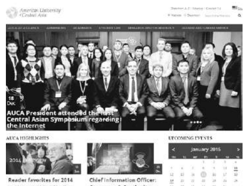
The new AUCA website design (screenshot)