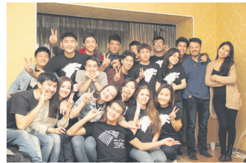
Korean family, Korean Delegation

One interesting fact: The most important thing for us in our delegations is to do everything perfect and sexy!