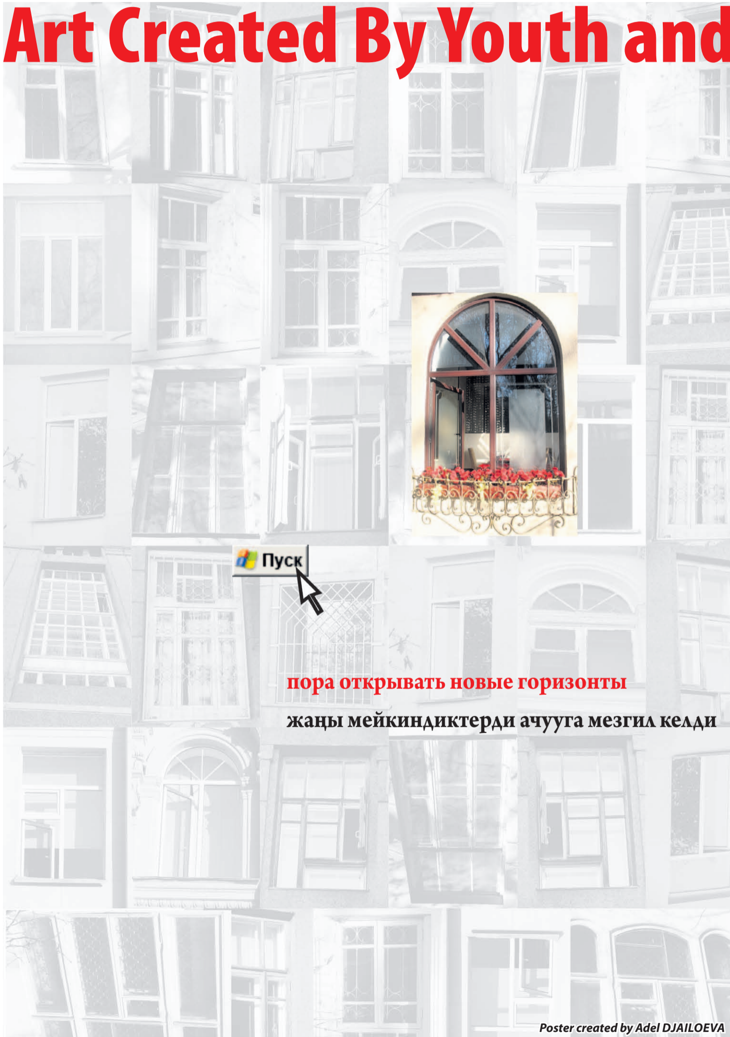
Poster created by Adel DJAILOEVA